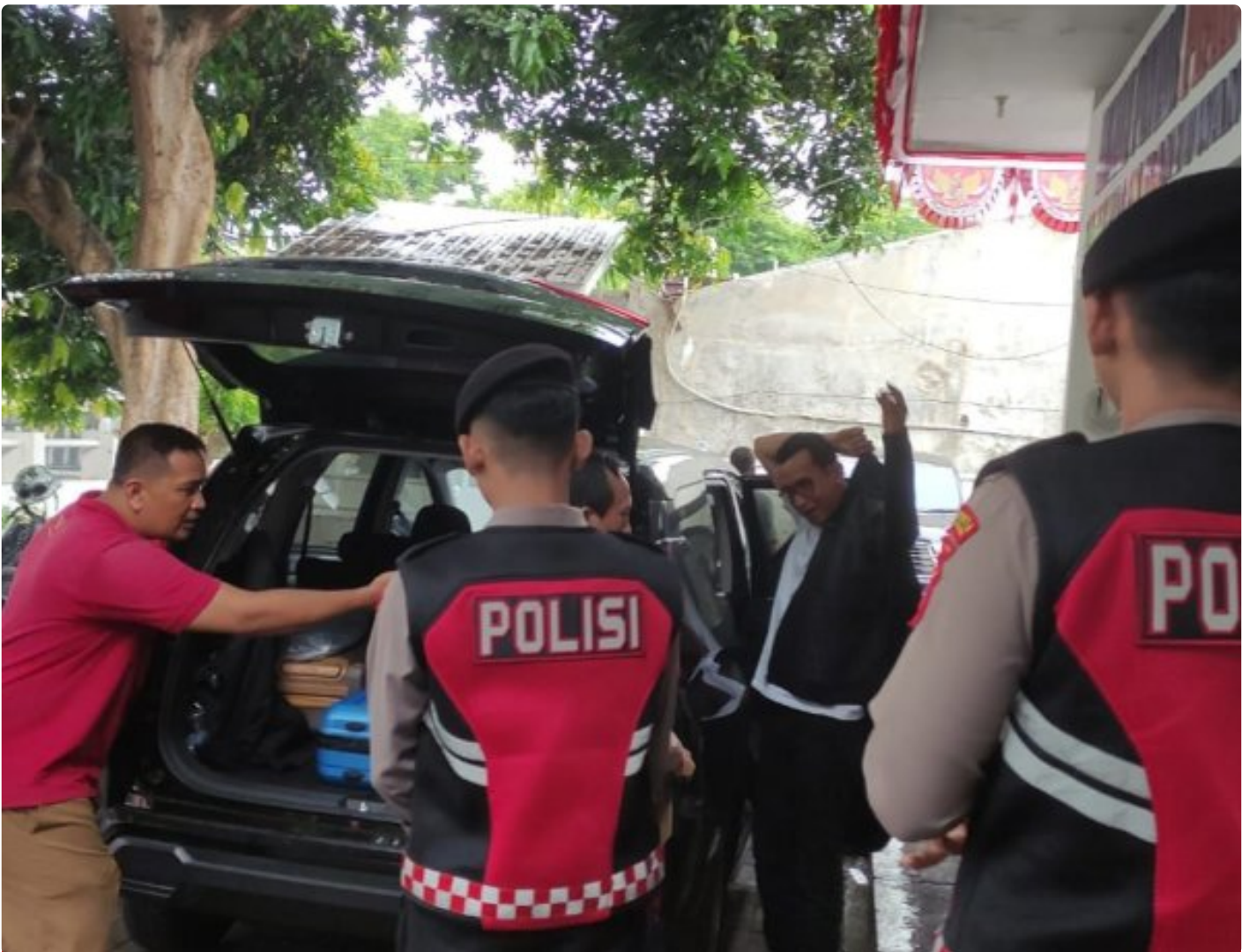
Personel Polresta Banyuwangi melakukan pengawalan ketat proses pengiriman hasil penghitungan surat suara Pilgub Jatim 2024 ke KPU Jatim

BANYUWANGI – Polresta Banyuwangi memberikan pengawalan ketat proses pengiriman hasil penghitungan surat suara Pilgub Jatim 2024 dari Kantor KPU